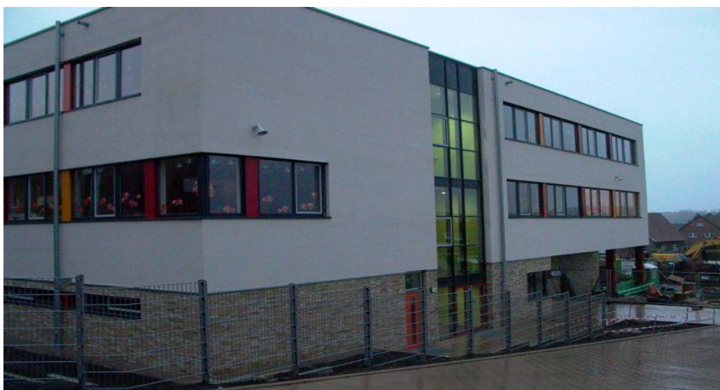
Grundschule Bad Bentheim

Als tijdelijke locatie hebben we een ruimte in Treff 10. Hier mogen we gebruik maken van de daar aanwezige faciliteiten.