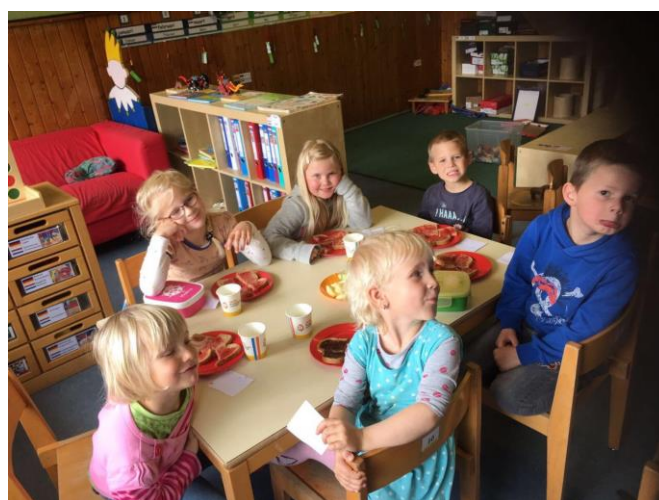
Groep 1 en 2