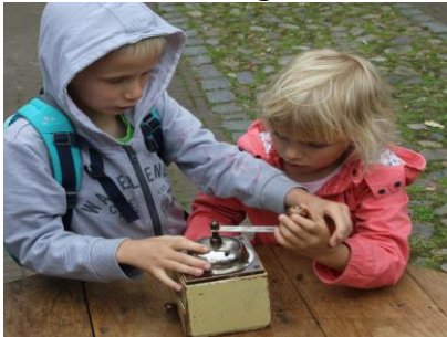
Samen koffie malen

We werken met de methode Nederland in Zicht, die bestaat uit 3 mappen. De onderbouw, middenbouw en bovenbouw zijn hierdoor verzorgd met een goed cultuuraanbod. De lessen worden met veel plezier gevolgd! Naast de methode, die iedere week ongeveer een halfuur wordt ingezet per groep, zijn er diverse culturele activiteiten opgenomen. We vieren een traditioneel Sinterklaasfeest, we vieren de Koningsdag door deel te nemen aan de Koningssspelen dit doen we samen met de Duitse kinderen, ons schoolreisje is ieder jaar voorzien van een culturele activiteit, zoals het bezoeken van een bekend museum. Er is aandacht voor 4 en 5 mei, er zijn spelletjesmiddagen met een culturele tint en de Kinderboekenweek wordt 'gevierd'. We proberen in het onderwijs zoveel mogelijk gebruik te maken van de actualiteit. Hierbij maken we gebruik van het weekjournaal. Ook de inbreng van kinderen is in deze lessen van grote waarde!