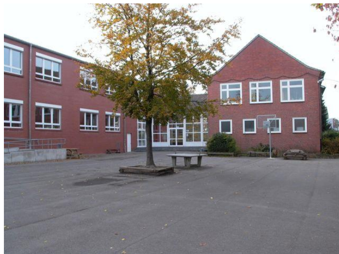
De Grund- und Hauptschule in Gildehaus

De lessen worden gegeven op de Grund- und Hauptschule Gildehaus, Grundschule Bad Bentheim, Kindertagesstätte Sonnenschein en Löwenzahn in Gildehaus en op het Missionsgynasium Bardel. De samenwerking met deze scholen zorgt ervoor dat onze leerlingen veelal na de lessen op de dagschool naar hun NTC-les kunnen gaan. Een aantal leerlingen komt van de Realschule en het Burg Gymnasium Bad Bentheim en neemt deel aan de NTC-lessen in de middag.