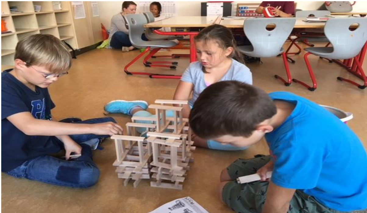
Samen bouwen 2017