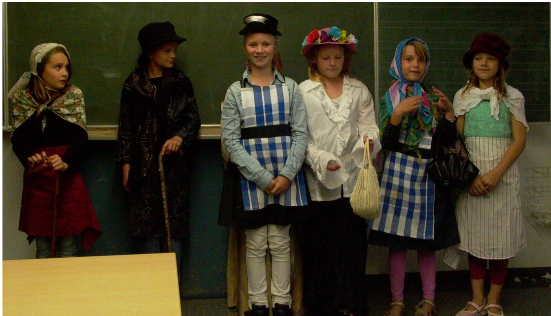
Kinderboekenweek 2016 ,Voor altijd jong`

Vanaf het schooljaar 2014-2015 is er op Kita Löwenzahn op woensdagmiddag een groep 1 en 2. Leerlingen van andere locaties kunnen hier ook deelnemen. De les vindt plaats in een groepsruimte van de Kita. Ook hier mogen we gebruik maken van de aanwezige materialen.