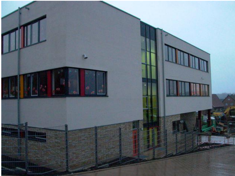
Grundschule Bad Bentheim

In een aangrenzend lokaal zijn twee kasten aanwezig, waar alle NTC-materialen te vinden zijn. De Brug mag gebruikmaken van de op locatie benodigde middelen om het onderwijs te faciliteren.