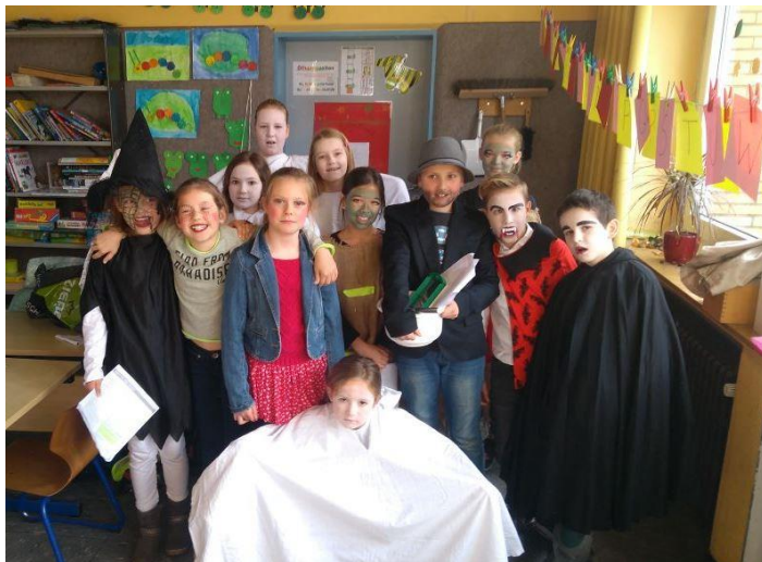
Kinderboekenweek 2017 'Gruwelijk eng'